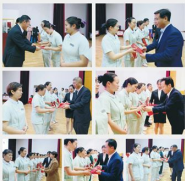
院领导分别为获奖选手颁奖

表彰是肯定，更是激励和鞭策。为创新服务模式、展示护理风采，办好护理实事，回顾经典案例，提升护理质量，护理部开展了护理“金点子”，随手拍、护理征文、护