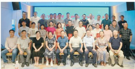
荆门市医学会肿瘤学分会成立大会暨肿瘤医学质量控制中心换届会议部分与会专家合影

控管理体系、评价标准。二是定期开展肿瘤专业学术交流，及时收集和掌握国际、国内最新理论和技术水平，积极探寻肿瘤专业诊治水平提高的新方法、新途径。”杨士勇表示，不论是市肿瘤学分会的成立，还是肿瘤专业学术交流活动的积极开展，都将为从事肿瘤专业的医务工作者搭建一个相互交流、资源共享的平台，不仅有利于推动技术创新、科研转化、医学教育等工作上的对外交流与合作，也更进一步提升荆门地区肿瘤诊疗水平，造福患者，当好肿瘤防治、人民健康的“守门人”。