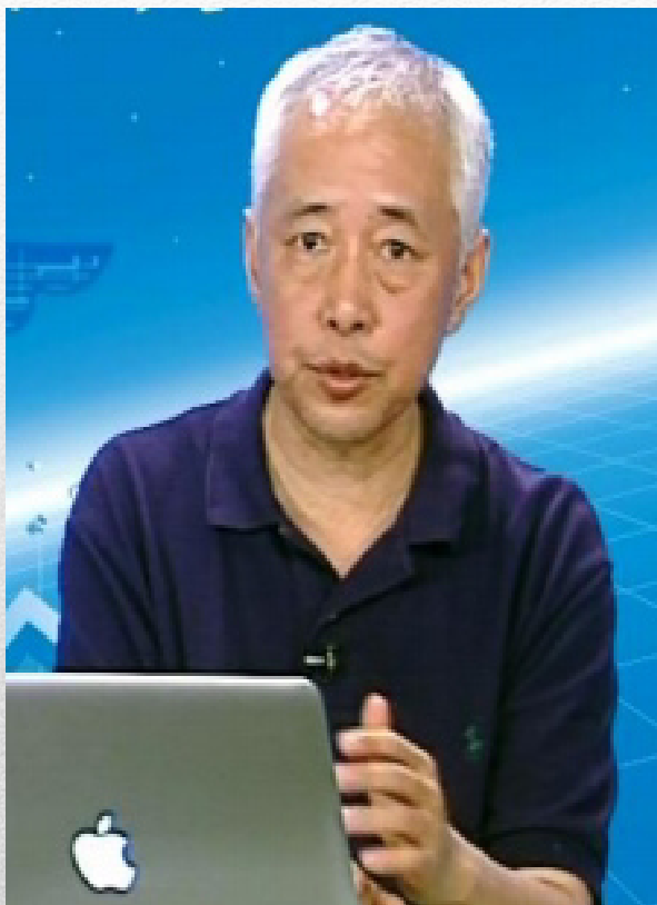
著名医院管理专家 张中南教授